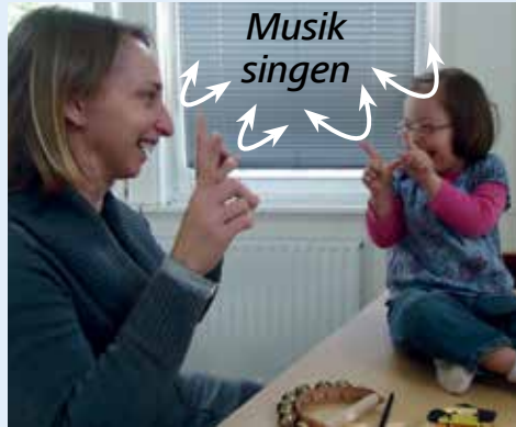
Gebärden erleichtern die Verständigung